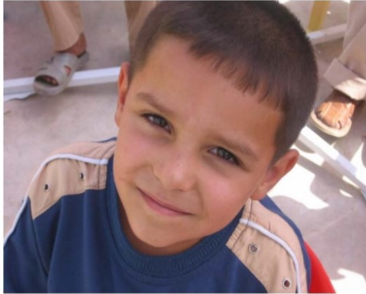
مناڵ توونوی زانیاری تازەییە

بابەتی نۆی، ئەمانە و بەدەیهەا چالاکی سوودبەخش لە باخچەدا دەبنە بەردی بناخەیی پەرەدەییکی چاک. شایانی باسە کە ئەمانە هەموو لە تاقیکردنەوەی جۆراوجۆر و جۆرە جیاوازی ماناڵاندا سەرچاوە دەگری. هەموو ئەو بیرو راو چۆنییەتی بیرکردنەوەیە لە نۆی ماناڵاندا پارێزگاری کردن و بەجۆشەو بەرەوچونە بۆ دروستکردنی زانیاریکی هەمە لایەنە کە ماناڵان سوودی لێدەبینن.