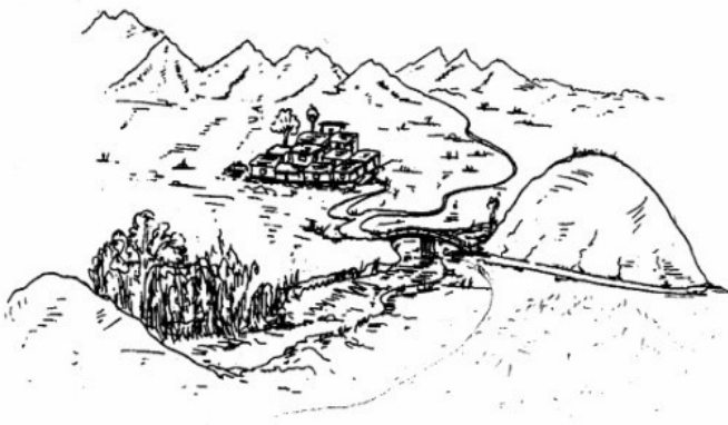
دیمه نیک له گونی سوننه ته له سالی ۱۳۲۵ خورشیدی

نیستا ناخرین مالاوایی و بهلینی نه حه د بوته تین و توان له دلی سارادا، به باشی بنجی داکتاوه و بووه ته قه لایه کی قایمیش بو دواروژی پیری و په ک که وتووی مام کهریم. نیستا سارا به دلیکی مالا مال له هیوا و نو مید به نه حه د، ده ستیک به زولف و کاکولی خوی برا که ی دا دینی و فرمیسه کان ده سزی و دیسانه وه برا که ی له قه لاندوشکانی ده کات و دهستی سه لمه ی خوشکی ده گری؛ به هیوا یه کی قورس و قایم به رهو هه واریکی نه دیو و نه ناسراو، به رهو دیاریکی نامو و نادیار، دهرن .