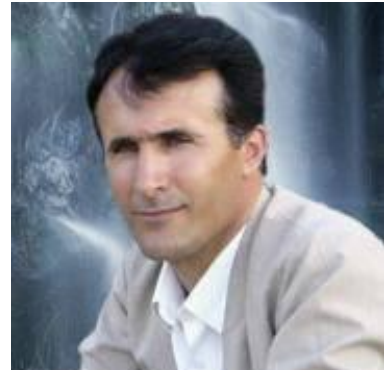
سوروكو زهكى ۲۱/۰۵/۲۰۱۷