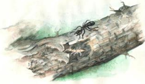
شەوبىر ئاۋرى داپەوہ:

بەلام لەو ساتەوہ وا من لەبىرم بىت دونيا پىرە لە كوني دىژىر درىژو.....ھەر ئەمەى تىدا ھەل ئەكەوئت، وا من ئەبىكرىنمەوہ.