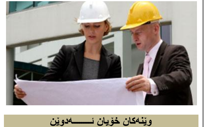
وينهكان خويان ددوين

بو يارمه تي و كومه ك گه ياندن به منالان و بهو كه سانه ي كه قورسترين دهر د و نه خو شيان تووش بووه و بو چاره سهر كردن هيچ سه رمايه و داهاتيكيان نيه، گو فاره كه مان هه لده ستيت به بلاو كردنه وه ي ژماره كو نتوو يه كي بانكي