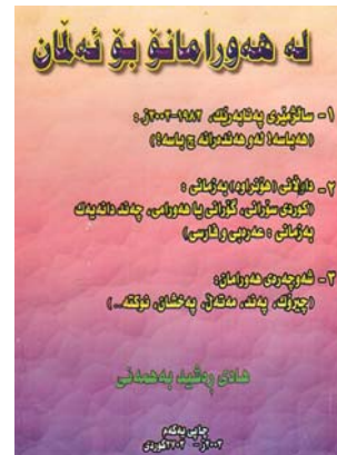
جە ھۆۋرامانى پەي ئالمانى

مامۇسا ھادى بەھمەنى تازەتەرىن بەر ھەمو وئش بەنامئ جە ھۆۋرامانۆو پەي ئالمانى وست وەرەو دەسو وانەرا. ئى بەر ھەمە تازە 150 لاپەرىش گرتەن وئ.