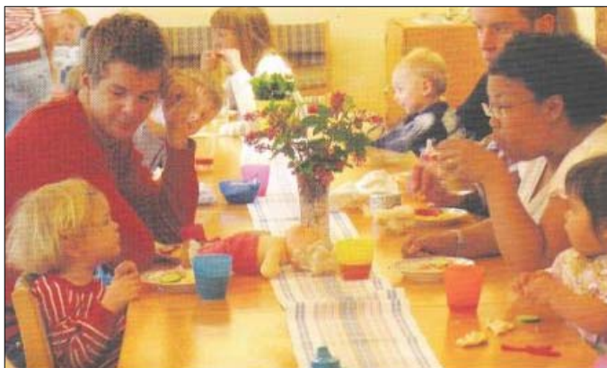
خوينه رانى خو شه ويست

رئخراوىكى زور به ناوبانگى سوئدى هه به ناوى Bris كه واته (مافى منالان له كۆمه لگا) ئم رپئخراوه به رده وام له چالاكيه كانيدا جه خت ده كاته سه ر مافى منال و به رنامه رپئى بۇ خيزان و موئسه ساته كانى كۆمه ل داده رپئى واته منالان له ته مهنى چوارتا پينچ ساليه وه ئاشناى مافه كانيان ده كه ن و پئيبان راده گه يه ن كه له كاتيكدا توند و تيژى له ههر لايه نيكه وه له دژيان به كار هئيرا يه كسه ر ته له فون بۇ ژماره به كى تاييه ت به كه ن و له ئاكامه كانى ئه و كاره هيج سل نه كه ن و نه ترسن. كار كردن و گرنگيدان به منال ته نها ئه ركى سه رشانى حكومت نيه به لكو هه موو چينو توئيزه كانى كۆمه ل ده گرئيه وه به تاييه ت ده سه لاتدارانى نيو كۆمه ل. جا وه كو نمونه ده توانرئيت ئاماژه بۇ پئزانينى ههر تاكه كه سئيك بكرئيت له و كۆمه لگايه نا ده كه ماف و ئه ركه كانيان زور روونه و ده زانن چون كاربه كن بۇ مافه كانيان، ته نانه ت كليساكانيان كر دۆته شوئنى په روه رده و گرنگى دان به مافى منال.