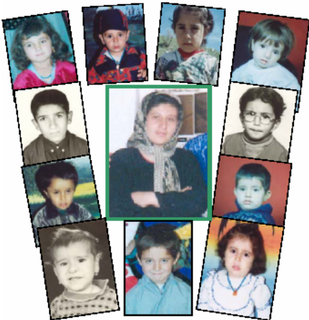
كۆچى يانەى سارا لە سلىمانىيەوہ بۇ سەقز و بۇكان بۇجى؟

گەرچى مامۇستا رەوف حەسەن بە پىچەوانەى پلانى من جىگەو پىگاي يانەكەى لە گەرەككىكى ھەزار نشىندا دابىن نەكرد، وەك چەكىكى بەرنەدى مەيدانى پكەبەرى دىزى نەيارانى سىياسى خۆى لە پىشچاۋ مەسئولانى كۆنە پەرسىتى ئەحزاب بەكارى ھىنا؟! بەلام بەو حالەش كە پىچەوانەى نيەت و ئامانجى من بوو سۇياسى دەكەم.