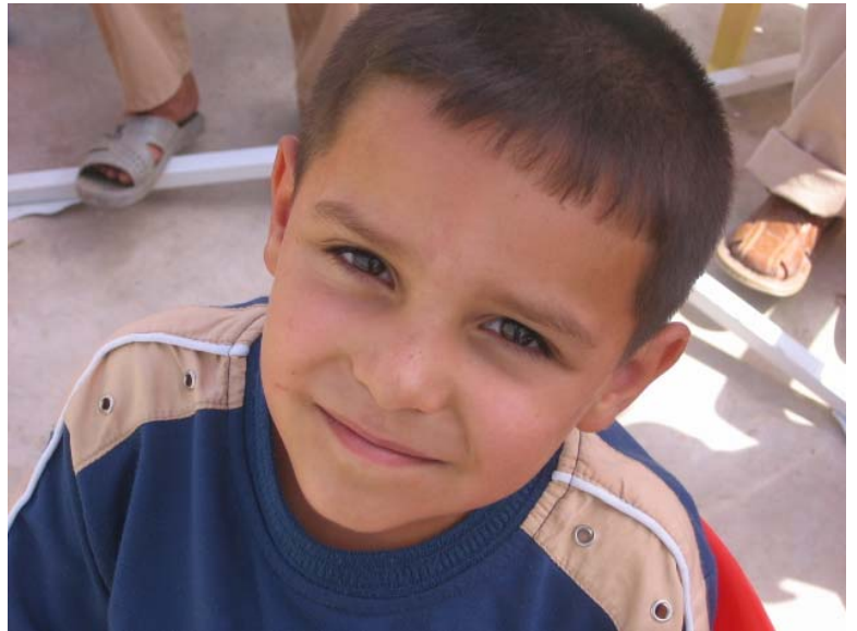
منالان توونوی زانیاری تازهییە

بابەتی نۆی، ئەمانە و بەدەییەها چالاکى سوودبەخش لە باخچەكەدا دەبنە بەردى بناخەى پەروردهیىكى چاك. شایانى باسە كە ئەمانە هەموو لە تاقىکردنەوى جۆراوجۆرو حەزو بۆچونى جىياوازی منالاندا سەرچاوه دەگرى. هەموو ئەو بیرو راو چۆنیىتى بیرکردنەویە لە نیو منالاندا پارێزگارى کردن و بەجۆشەوه بەرهەوچونە بۆ درووستکردنى زانیاریىكى هەمە لایەنە كە منالان سوودی لێدەبینن.